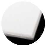
ULTIMA Beveled Tegular