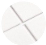
ULTIMA con Reticula de Te expuesta SUPRAFINE 9/16"