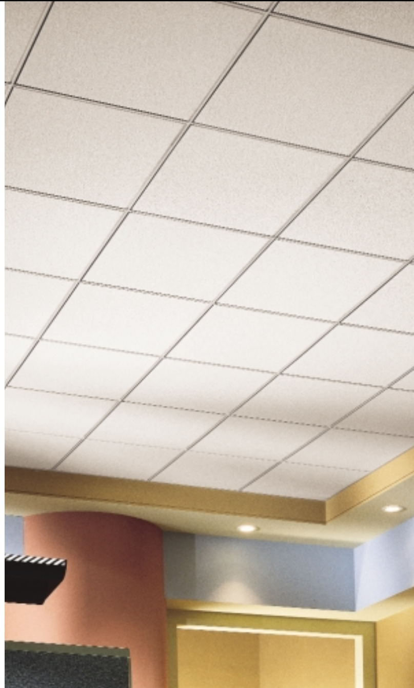
ULTIMA Beveled Tegular con Sistema de Suspensión de Te Dimensional SONATA 9/16"