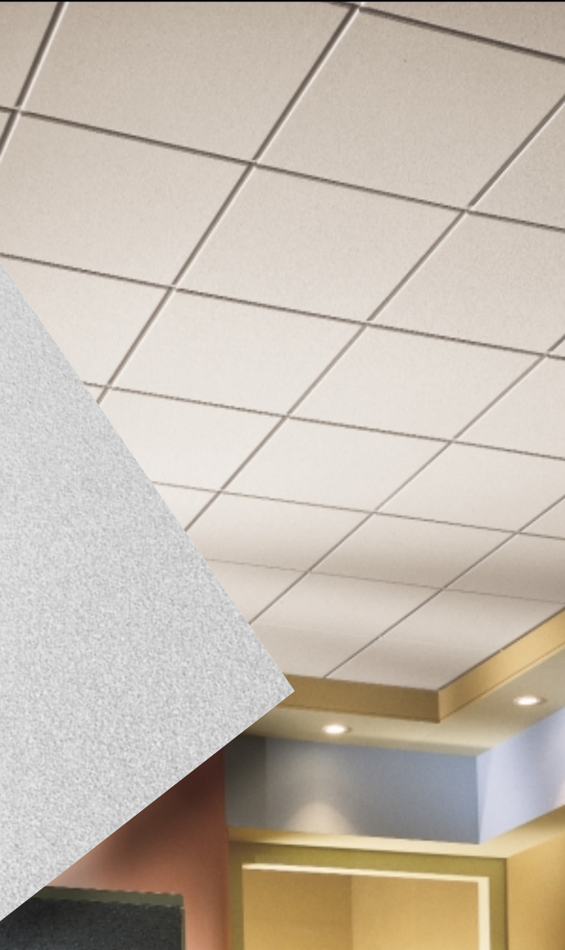
ULTIMA Beveled Tegular con Reticula de Te expuesta SUPRAFINE 9/16"