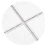
ULTIMA con Ranura para perno SILHOUETTE XL 9/16" 1/4" Ranura