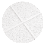
FINE FISSURED Square Lay-in con Reticula de Te expuesta PRELUDE 15/16"