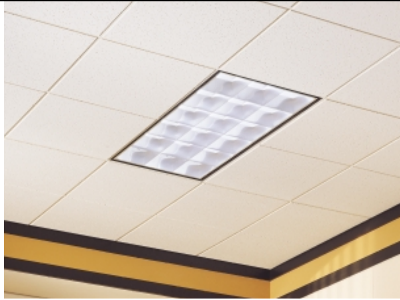
CORTEGA Second Look II con Reticula de Te Expuesta SUPRAFINE 9/16''