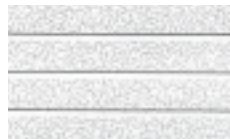
Second Look III ranuras generan tableros lineales de 6" nominales