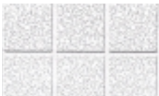
Second Look I ranuras generan cuadros de 12" x 12" nominales