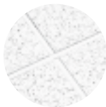
CORTEGA Second Look con Reticula de Te Expuesta SUPRAFINE 9/16''