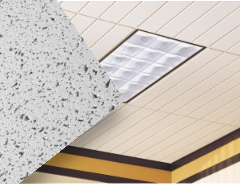
CORTEGA Second Look III con Reticula de Te Expuesta SUPRAFINE 9/16''