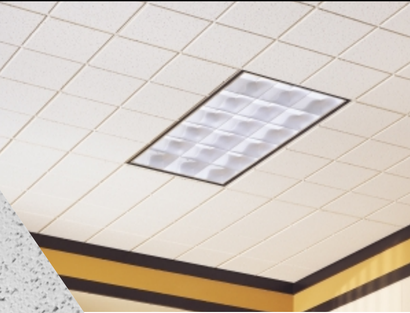
CORTEGA Second Look I con Reticula de Te Expuesta SUPRAFINE 9/16''

10-YEAR AVAILABILITY GUARANTEE Artículos 2765, 2767, 2768 & 2790