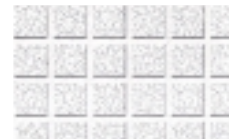
Second Look IV ranuras generan cuadros de 6" x 6" nominales