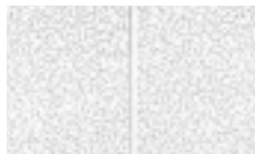
Second Look II ranuras generan cuadros de 24" x 24" nominales