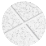
CORTEGA con Reticula de Te expuesta SUPRAFINE 9/16"