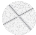
CORTEGA con Ranura para perno SILHOUETTE 9/16" Ranura 1/4"