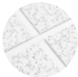
CORTEGA con Reticula de Te expuesta PRELUDE 15/16"