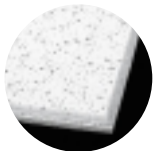
CORTEGA Beveled Tegular