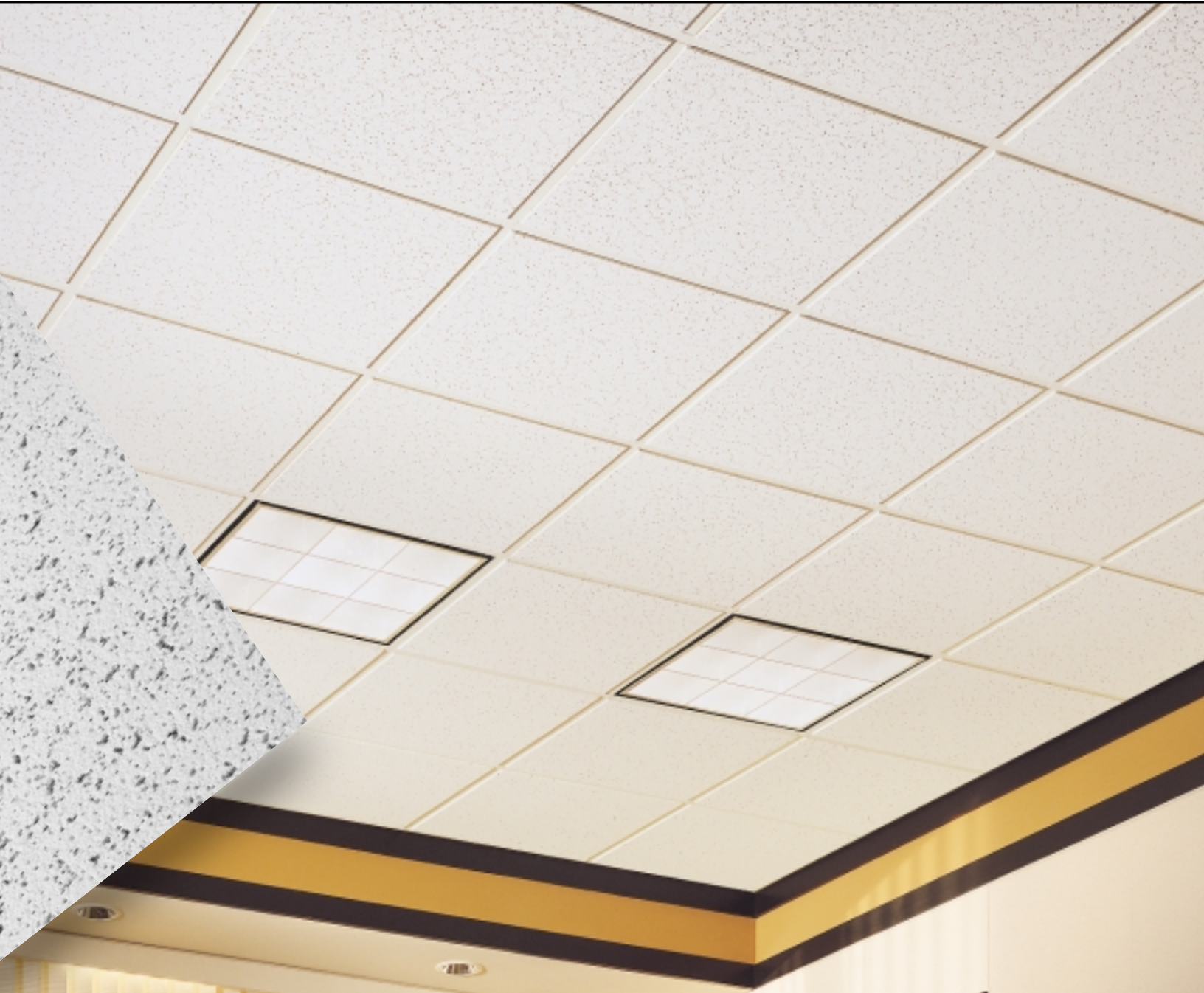
CORTEGA Angled Tegular con Reticula de Te expuesta PRELUDE 15/16"