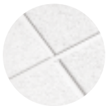
CIRRUS Beveled Tegular con Reticula de Te expuesta SUPRAFINE 9/16"