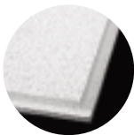
CIRRUS Angled Tegular