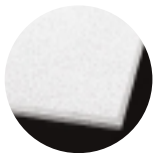
CIRRUS Beveled Tegular