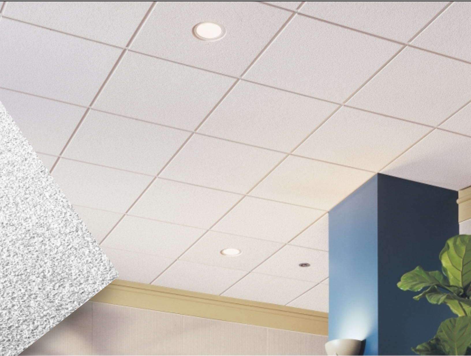
CIRRUS Beveled Tegular con Reticula de Te expuesta SUPRAFINE 9/16"