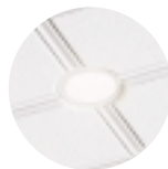
Disponible con Hardware Friendly Options (Opciones de Herrería de Fácil Instalación)