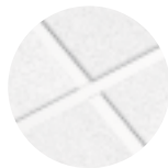
CIRRUS Angled Tegular con Reticula de Te expuesta PRELUDE 15/16"